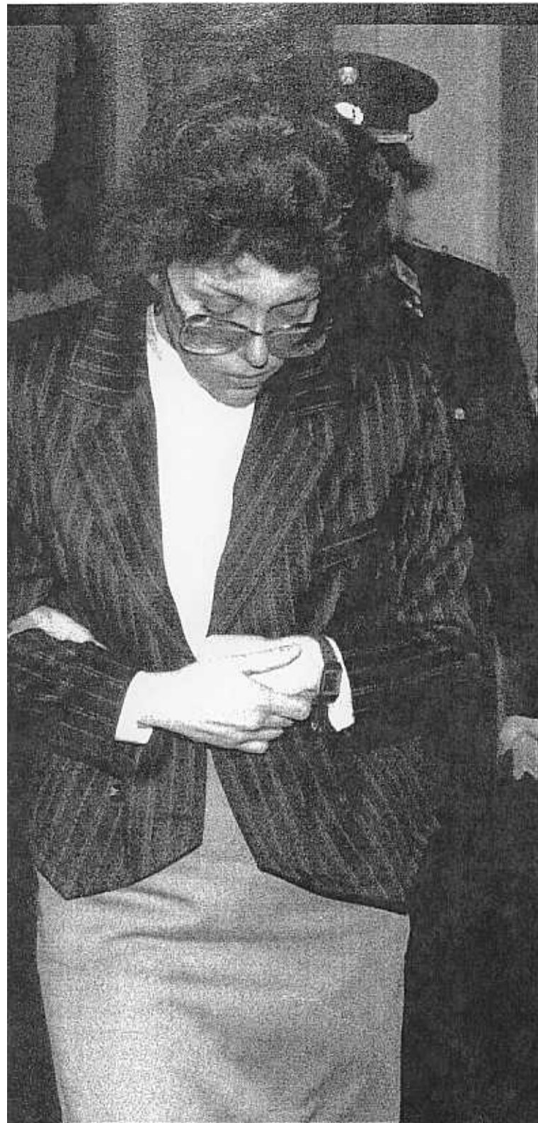
WAGNER Schmalen Grat zwischen Sterbehilfe und bestialischem Mord