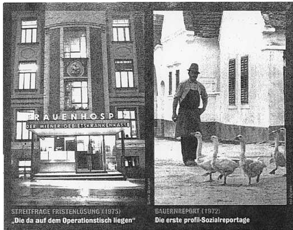
STREITFRAGE FRISTENLÖSUNG (1975) „Die da auf dem Operationstisch liegen“

Abseits jedes Skandals, abseits jedes Verbrechens jedoch sind in der jüngeren Vergangenheit in profil einige beeindruckende Sozialreportagen erschienen, unter anderem von Eva Menasse. So rekonstruiert sie etwa das kurze Leben eines zehnjährigen