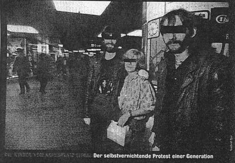
INE KISSER VOM ARBEITSPLATZ 1996 Der selbstvernichtende Protest einer Generation