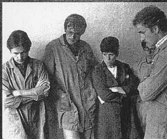
FAEL ERMIG (1991) Sozialberichte als Nekrologe