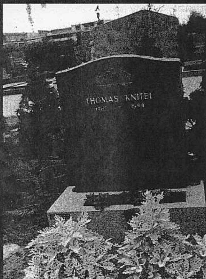
TOD EINES PFLIEGERKINDES (1984) Das kurze Leben eines Zehnjährigen