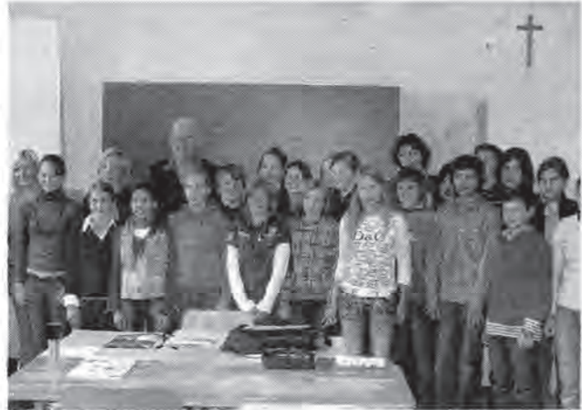
תצלום: לימוד אוי

הוותיק, כדי שיפתח את גנוכיו מתקופת השואה. התברור בארגון מתבצעת בפועל באמצעות פקידים בכירי רים משרדי החוץ של המדינות התברורות, מה שהופך אותו לגוף מדיני. הנגהת הארגון עוברת בין המדינות התברורות, וכל אחת משמשת בתפקיד במשך שנה. השנה אוסטרליה היא היריב ובין תפקידיה, היא מארחת את כנסי הארגון; שני כנסי מליאה ושני כנסי ועדות בכל שנה, מה שמגדיר את העול התקציבי על המדינה יושבת הראש. ובכל זאת, כשעלתה בראשית הדרך הצעה לגייס תרומות מגורמים פרטיים, רחו המדינות את הצעה, והעי ריפו להגדיר את סכום ההקצבה השנתית שלהן.