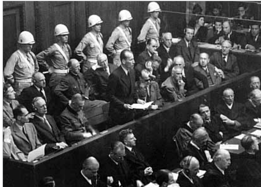
Ernst Kaltenbrunner (in der Mitte stehend) vor dem Nürnberger Hauptkriegsverbrecherprozess

Befehle dieser Art wurden normalerweise mit seiner Unterschrift ausgegeben. [...] Kaltenbrunner selbst befahl die Hinrichtung von Gefangenen. [...] Das RSHA spielte eine führende Rolle bei der ‚Endlösung‘ des jüdischen Problems durch Ausrottung der Juden.“ 4 In revisionistischen Kreisen, in dem der Holocaust geleugnet oder verharmlost wird, wird dieses Urteil nicht anerkannt. Die Grazer Burschenschaft Arminia gedenkt weiterhin ihrem Bundesbruder Ernst Kaltenbrunner.