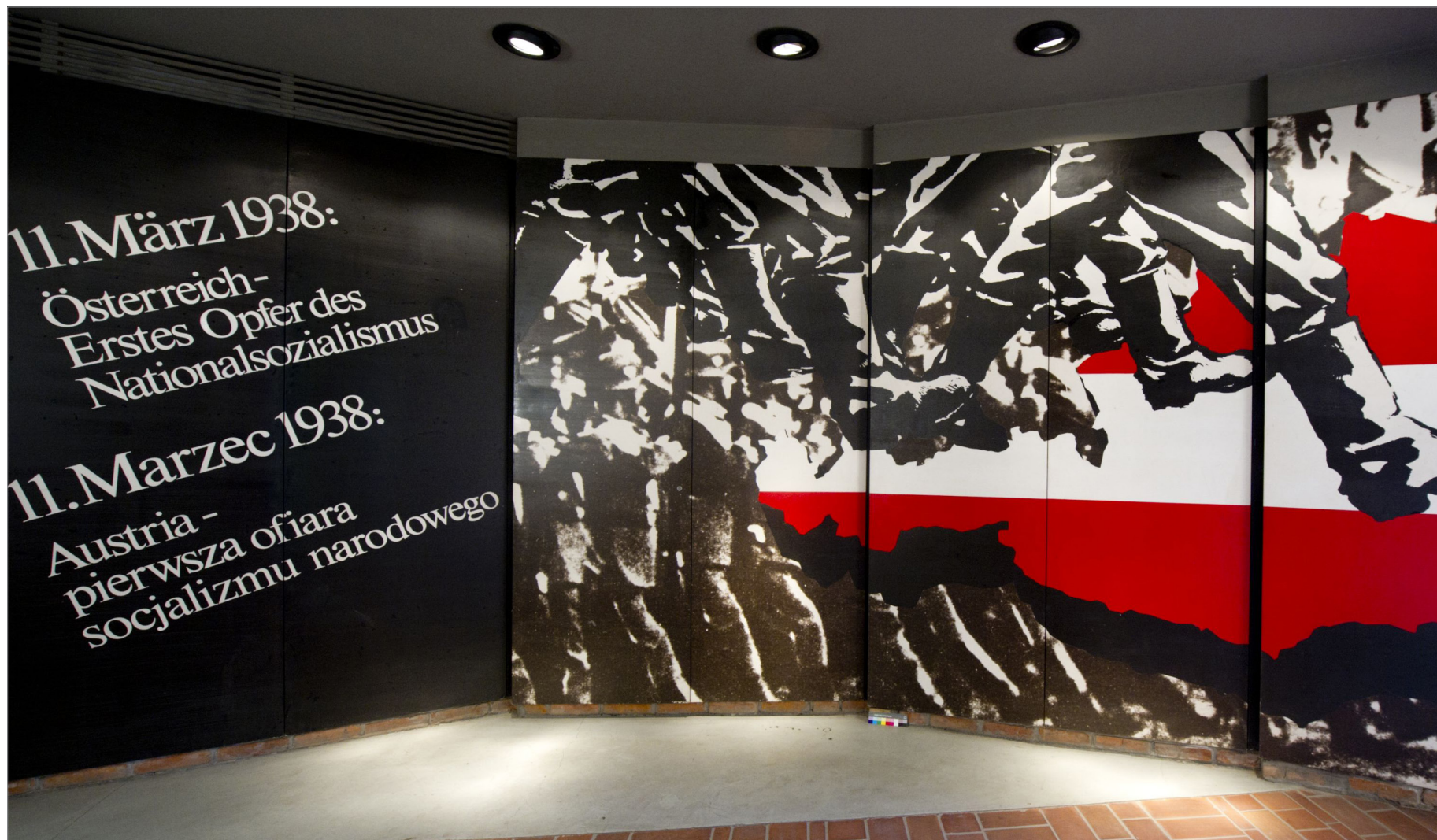
Bildunterschrift: Tafel im Eingangsbereich der ersten österreichischen Ausstellung im Block 17, Grafik Ernst Fuhrherr