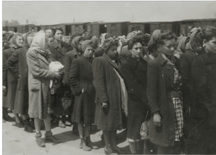
Jüdische Frauen in Auschwitz, die für die Zwangsarbeit selektiert werden

Obwohl es über den Umstand ihres Todes keine Zweifel gibt, wird für Maria Mandl 1975 aufgrund falscher Mitteilungen der Gemeinde Münzkirchen vom Kreisgericht (heute: Landesgericht) Ried eine Todeserklärung ausgestellt, die bescheinigt, dass Mandl angeblich 1939 in ein Konzentrationslager eingeliefert wurde und sie vermutlich 1944 ums Leben gekommen ist. So wird aus der Kriegsverbrecherin plötzlich ein Opfer des NS-Terrors. Erst 2017 erfolgt eine Korrektur, und die Todeserklärung wird vom Landesgericht Ried aufgehoben.