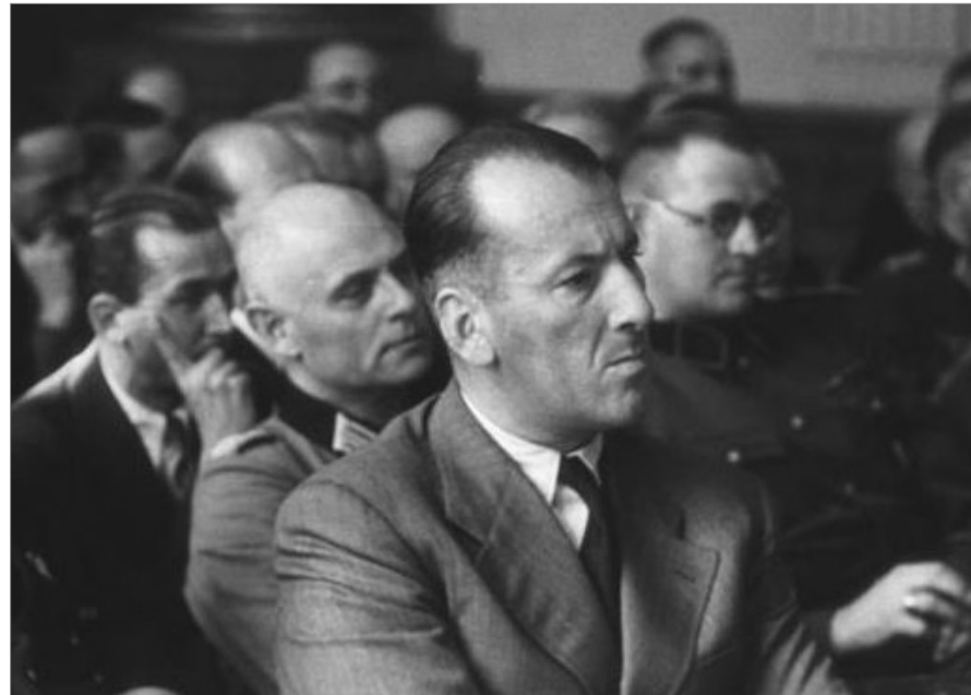
Ernst Kaltenbrunner als Zuschauer im Volksgerichtshof (1944)

Ihr Aufgabenbereich umfasst die Verhaftungen sowie die Einweisungen in →Konzentrationslager und die Organisation und Durchführung der →Deportationen. Einer von Kaltenbrunners Untergebenen war ein Bekannter aus seiner Schulzeit in Linz: Adolf Eichmann, der für die Planung der Transporte in die Lager zuständig ist. Kurz vor Kriegsende versteckt sich Kaltenbrunner in einer kleinen Hütte im Toten Gebirge im Salzkammergut. Ein paar Tage später wird er dort von den Amerikanern mit der Hilfe des lokalen Widerstandes gefangen genommen.