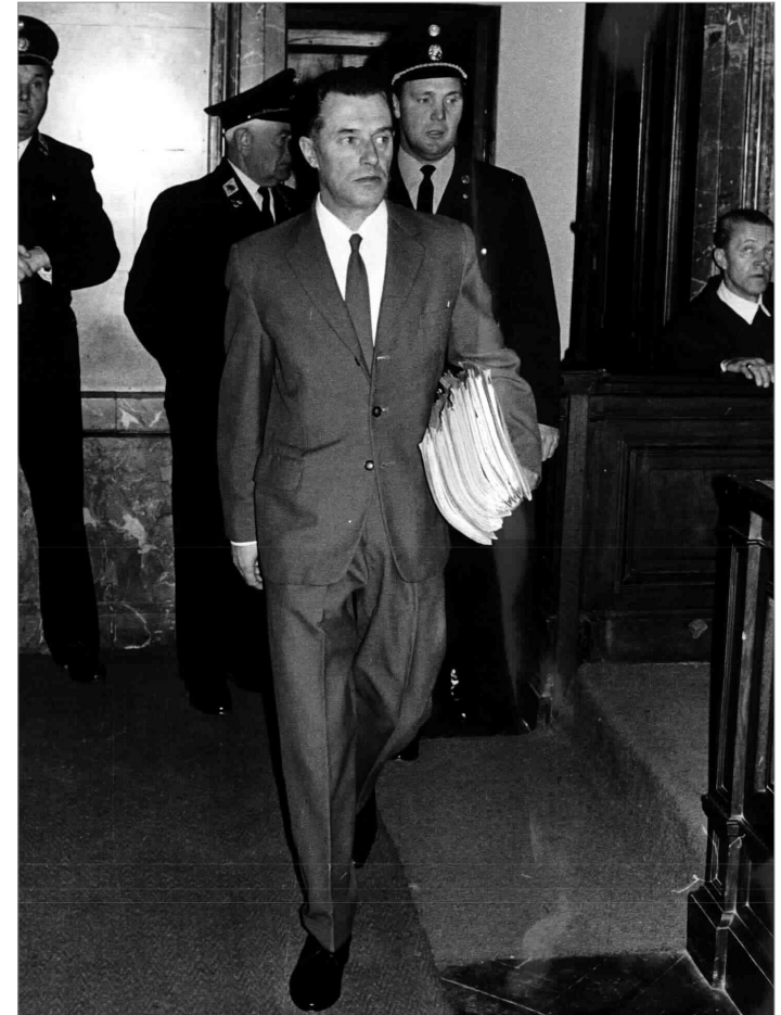
Franz Novak betritt 1966 den Gerichtssaal

Der Oberste Gerichtshof hebt dieses Urteil auf. In einem vierten Prozess 1972 kommt es zu einem neuerlichen Schuldspruch am Gericht in Wien. Nun lautet das Urteil wieder sieben Jahre Gefängnis, unter anderem wegen der Beteiligung an der Deportation von 400.000 ungarischen Jüdinnen und Juden. 1974 entscheidet Bundespräsident Rudolf Kirchschläger, dass Novak die restliche Strafe (die Zeit in der Untersuchungshaft wurde schon angerechnet) nicht mehr absitzen muss. Simon Wiesenthal hat später ausgerechnet, dass Novak für jedes einzelne Opfer, das er nach Auschwitz zur Ermordung gebracht hatte, nur drei Minuten und 20 Sekunden in Haft war.