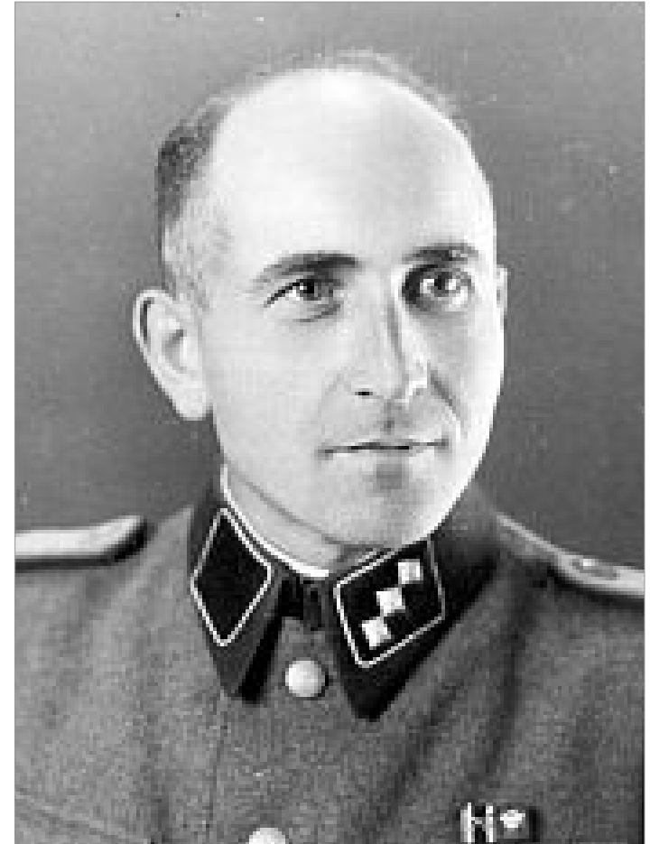
Fotografische Selbstdarstellung Maximilian Grabners

Am 30. November 1943 wird Grabner wegen Korruption verhaftet. Der Vorwurf lautet, ohne Absprache mit übergeordneten Stellen die Erschießung von Häftlingen angeordnet zu haben. Der Prozess findet vor einem eigenen SS-Gericht statt, wird jedoch nie abgeschlossen. Grabner kann wieder zur Gestapo zurück und wird nach Kattowitz und später nach Breslau versetzt.