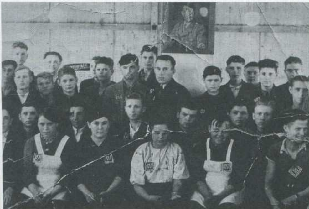
Die jüngsten Zwangsarbeiter im „Aufbaulager Silbertal“ waren gerade 14 Jahre alt. Heute leben nur mehr ganz wenige der einstigen Lagerinsassen. Zu einigen wurde in den letzten Jahren Kontakt hergestellt und sie wurden zu wichtigen Zeitzeugen.